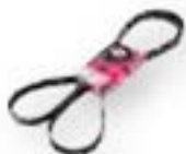
Correa acanalada Micro-V® Horizon™