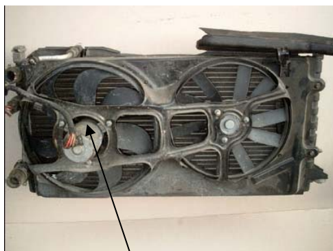
Fig. 1: elektriskt driven fläkt

För ett antal år sedan var PJ profilen endast använd på industri maskiner, speciellt på "vitvaror", som diskmaskiner och torktumlare. Senare blev dessa små Micro-V remmar introducerade I den automotiva industrin, där drift av fläktar är deras huvudsakliga område. Normalt har bilar endast en fläkt som är driven av en elektrisk motor (Fig. 1).