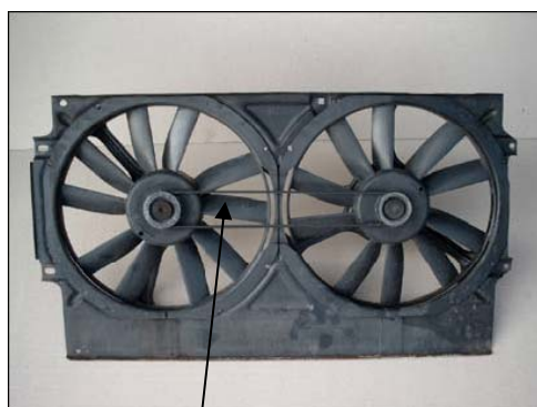
Fig. 2: PJ rem

I de fall då det finns behov av extra kylning (bilar med som har behov att föra ett stort luftflöde genom kylaren, taxi, bilar med AC, etc), har en extra fläkt installerad. Den andra fläkten är oftast driven av samma elmotor som den första via en 2 eller 3 ribbad PJ rem (Fig. 2).