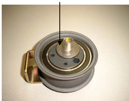
Kuva 3. OE-n:o 058109243D

Jos nämä osat vaihtuvat keskenään, on seurauksena hihnan väärä aksiaalisuus (suuntaus) ja hihnan tuhoutuminen. Jos kiristimen valinnassa on epävarmuutta, tarkista aina, että uudessa kiristimen hihnapyörässä on sama aluslevyn paksuus kuin korvattavassa osassa.