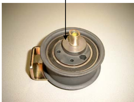
Kuva 2. OE-n:o 058109243E