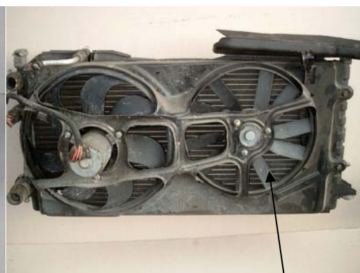
Fig. 2: Cinghia PJ

Nel caso sia necessario maggiore raffreddamento (auto con aria condizionata, veicoli con gancio rimorchio di serie, taxi, etc.), un secondo ventilatore è installato per portare più aria al radiatore. Spesso questo secondo ventilatore è guidato dal primo da una cinghia con 2 o 3 strie a profilo PJ.