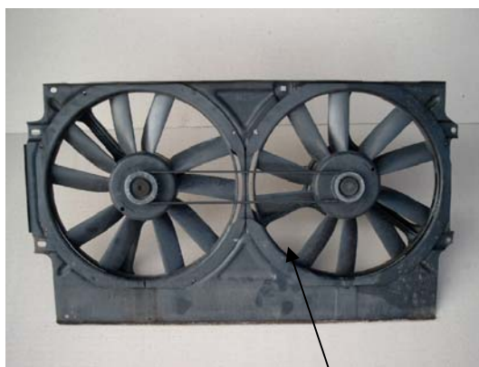
Fig. 1: Ventilatore elettrico

Solitamente la configurazione base del motore ha solo 1 ventilatore, guidato elettricamente (sistema installato sul radiatore). (Fig.1).