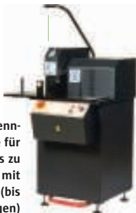
Schlauchtrennmachine für Schläuche bis zu Nennweite 2" mit Multispiralbraht (bis sechs Spiraleinlagen)