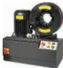
Schlauchmontagepresse für Hochleistungsschläuche mit sechs Spiraldrahteinlagen

maximalen Betriebsdrücke dieser Armaturen geachtet werden, da diese den Betriebsdruck der Schlauchleitung erheblich senken können. In Tabelle 2 wird ein Überblick über die maximalen Betriebsdrücke für Armaturen gemäß der verschiedenen Industrienormen gegeben, und zwar im Vergleich zu den Betriebsdrücken nach EN 856 4SP.