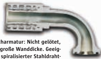
Einteilige Flanscharmatur: Nicht gelötet, kegeliger Flanshbund, große Wanddicke. Geeignet für Schläuche mit spiralisierte Stahlbraht-einlage und damit für sehr hohen Druck. Das Schälen der Schläuche erübrigt sich, da sich die Hülse in die Stahlbrahtspirale „beißt“

Bei der Konstruktion von Hydraulikkreislaufsystemen ist die Sicherheit von immenser Bedeutung, insbesondere im Hinblick auf die hohen Drucklinien beim Einsatz von Spiraldrahtschläuchen. In Europa wurde diese Tatsache mit der europäischen Maschinenrichtlinie 98/37/EG in die Gesetzgebung aufgenommen. Diese Richtlinie besagt, dass sämtliche Schlauchleitungen an einer Maschine den DIN- und EN-Anforderungen entsprechen müssen und genehmigte Aufzeichnungen über sämtliche Eignungs- und Produktionskontrollprüfungen einschließlich der Impulsprüfung vorhanden sein müssen. In den Industrienormen wie z.B. der DIN20066 wird empfohlen: „Schlauchleitungen dürfen nur aus solchen Schläuchen und Armaturen, deren Funktionsfähigkeit als definierte Schlauch-Armaturen-Kombination in Prüfungen gemäß den relevanten Schlauch- und Armaturennormen