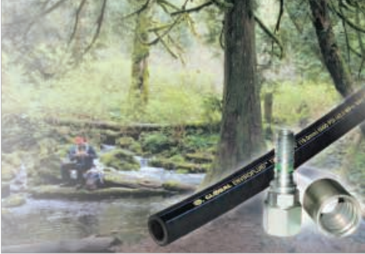
Multispiralschlauch mit Nitril-Seele: Bei höchstem Druck beständig auch gegenüber umweltfreundlichen Bio-Ölen

Drücken und hohen Temperaturen sicherzustellen. Doch leider ist Chloropren gegenüber Öl nicht optimal beständig. So können aggressivere Öle, insbesondere biologisch abbaubare Öle, durch die Schlauchseele sowie die verschiedenen Friktionsschichten zwischen den Einlagen hindurchdringen. Dieser Effekt verstärkt sich bei Ölen mit geringer Viskosität, bei hohen Temperaturen oder wenn Zusätze zur Verbesserung der Viskosität verwendet werden. Außerdem kann sich Öl unter der Schlauchdecke sammeln und Blasen verursachen oder durch die Schlauchdecke dringen und sichtbare Ölspuren zur Folge haben (schwitzen). Alternativ dazu gibt es heute Schläuche mit einer speziellen Schlauchseele auf Nitril-Basis, die einer Dauertemperatur von 120 °C standhalten kann und eine hervorragende Beständigkeit sicherstellt – sogar gegenüber den aggressiven biologisch abbaubaren Ölen (Bild 1).