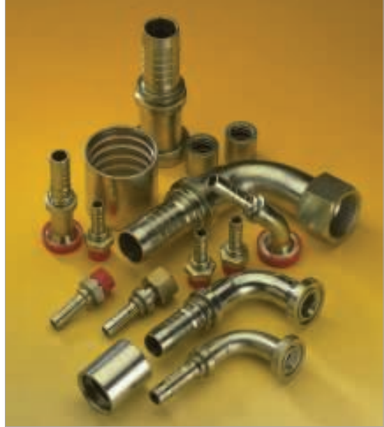
Armaturen speziell für Spiraldrahtschläuche sorgen für eine dauerhaft sichere Verbindung bei bis zu 42 MPa Betriebsdruck

Nur wenige Hersteller bieten eine komplette Produktpalette an Armaturen für Spiraldrahtschläuche an. Gates liefert diese Armaturen unter der Marke „GlobalSpiral“ (Bild 2) für die Schlauchreihen „GxK“ und „EF-GxK“, welche