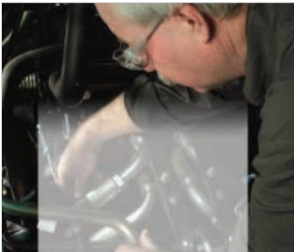
Spiraldrahtschläuche in der Hydraulik? Da denken viele zuerst einmal an Probleme

Weitere Infos unter www.safehydraulicseurope.com