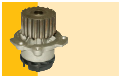
Номер части Gates: 7702-00001 OEM: 2112-1307010-10

В настоящее время Gates предлагает три совершенно новых насоса, специально разработанных для семейства автомобилей Лада: