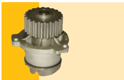
Номер части Gates: 7702-00002 OEM: 2108-1307010

Lada 2110 - 16V (Двигатель VAZ2112), 1499cc ..... 02/99 Lada 2111 - 16V (Двигатель VAZ2112), 1499cc ..... 02/00 Lada 2112, 1499cc ..... 06/98