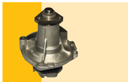
Номер части Gates: 7702-00003 OEM: 2101-1307010 2101-1307014 2101-4197598

Samara 1.1, 1099cc ..... 03/92-07/97 Samara 1.3, 1288cc ..... 03/92-07/97 Samara 1.3i, 1288cc ..... 04/96 Samara 1.5, 1499cc ..... 03/92-05/95 Samara 1.5i, 1499cc ..... 06/95 Samara Cabrio 1.1, 1099cc ..... 03/92-10/97 Samara Cabrio 1.3, 1288cc ..... 03/92-05/95 Samara Cabrio 1.5, 1499cc ..... 03/92-05/95 Samara Cabrio 1.5i, 1499cc ..... 06/95-10/97