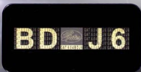
Eine Holospot®-Sicherheitsmarkierung ist ein mehrschichtiges Etikett mit einem kleinen Datenfeld, das verschiedene Sicherheitsmerkmale enthält.

Daher wird Gates auf den PowerGrip® Zahnriemen-Verpackungen eine neue Sicherheitsmarkierung anbringen, mit der Sie die Original-Gates-Qualität besser von Fälschungen unterscheiden können. Wenn Sie also eine Fälschung von dem Original-Artikel unterscheiden wollen, achten Sie auf den Gates-Holospot®.