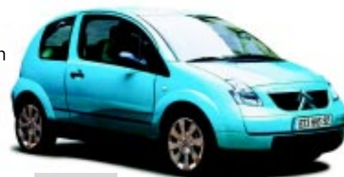
Citroën C2 Cinghie di distribuzione

I tecnici Gates organizzano corsi di formazione, in collaborazione con i clienti. In questo modo avrete l'occasione di specializzarvi – per esempio – nel montaggio delle cinghie ed imparare come prevenire guasti prematuri alle cinghie.