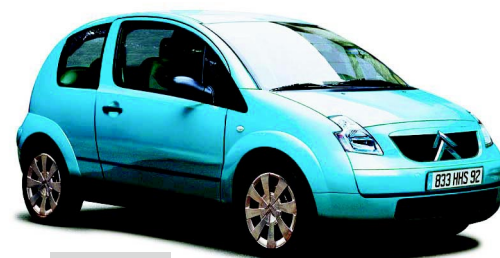
Citroën C2 Courroies de distribution

L'équipe technique de Gates organise régulièrement des sessions de formation, en collaboration avec ses clients directs. Ainsi, vous pourrez, par exemple, devenir un spécialiste en montage de courroies apprenant ainsi à éviter des ruptures prématurées de courroies.