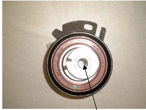
Kuva 3 A