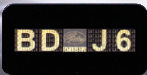
El Holospot®, una marca de seguridad, consta de una etiqueta de varias capas y con diferentes rasgos.

Para ayudarle a distinguir la calidad Gates original de una falsificación, Gates está aplicando un holograma en las cajas de sus correas de distribución PowerGrip®. Para reconocer el producto auténtico, basta con buscar el Holospot®.