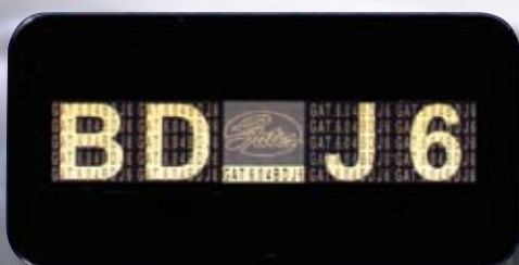
Une étiquette Holospot® est un marquage de sécurité à plusieurs niveaux.

C'est pour cette raison que Gates appliquera dorénavant à ses courroies de distribution PowerGrip® un hologramme de sécurité qui permettra de distinguer un original Gates d'un produit contrefait. Pour discerner le vrai du faux, cherchez tout simplement l'Holospot®.