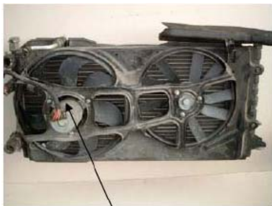
Fig 1. Electronisch aangedreven fan

Deze smalle Micro-V riemen worden echter ook in de automotive industrie toegepast, waar de hoofdapplicatie de ventilator is. Gewoonlijk heeft de basismotorconfiguratie slechts 1 ventilator, welke elektronisch wordt aangedreven (systeem geïnstalleerd op de radiator).