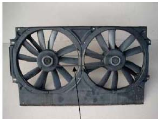
Fig 2. PJ riem

In het geval dat additionele koeling vereist is (auto's met airconditioning, met een af fabriek gemonteerde trekhaak, taxi's etc), wordt een tweede ventilator gemonteerd om meer luchtkoeling door de radiator te zuigen. De tweede ventilator wordt dan vaak door de eerste aangedreven door middel van een 2 of 3 ribs PJ riem.