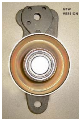
Рис. 2 OE соотв.7700871169