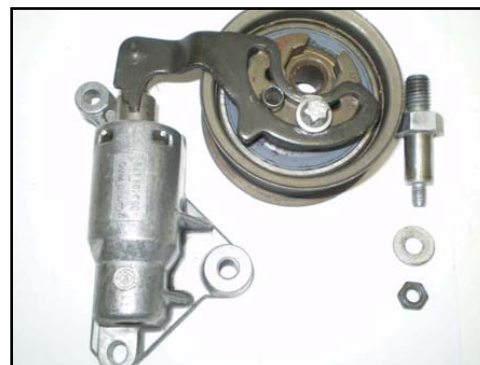
Abb.2 Altes Spannsystem